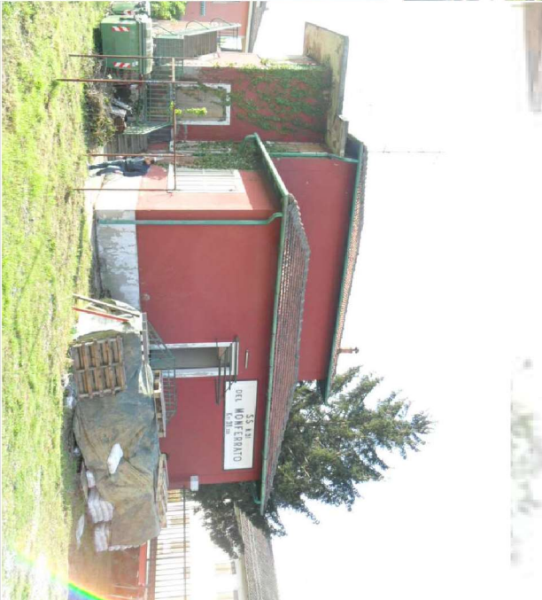
Vista laterale, prospetto Nord-Ovest